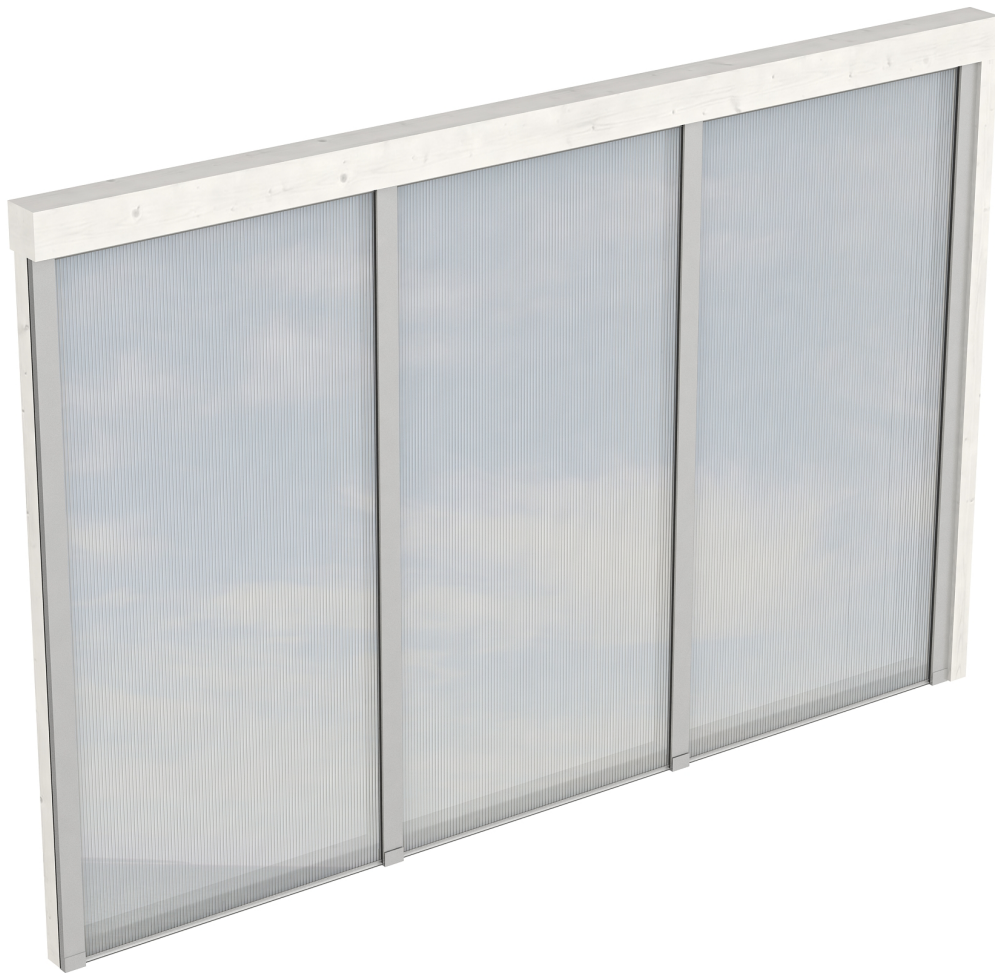
Produktbild Polycarbonat-Seitenwand 305cm