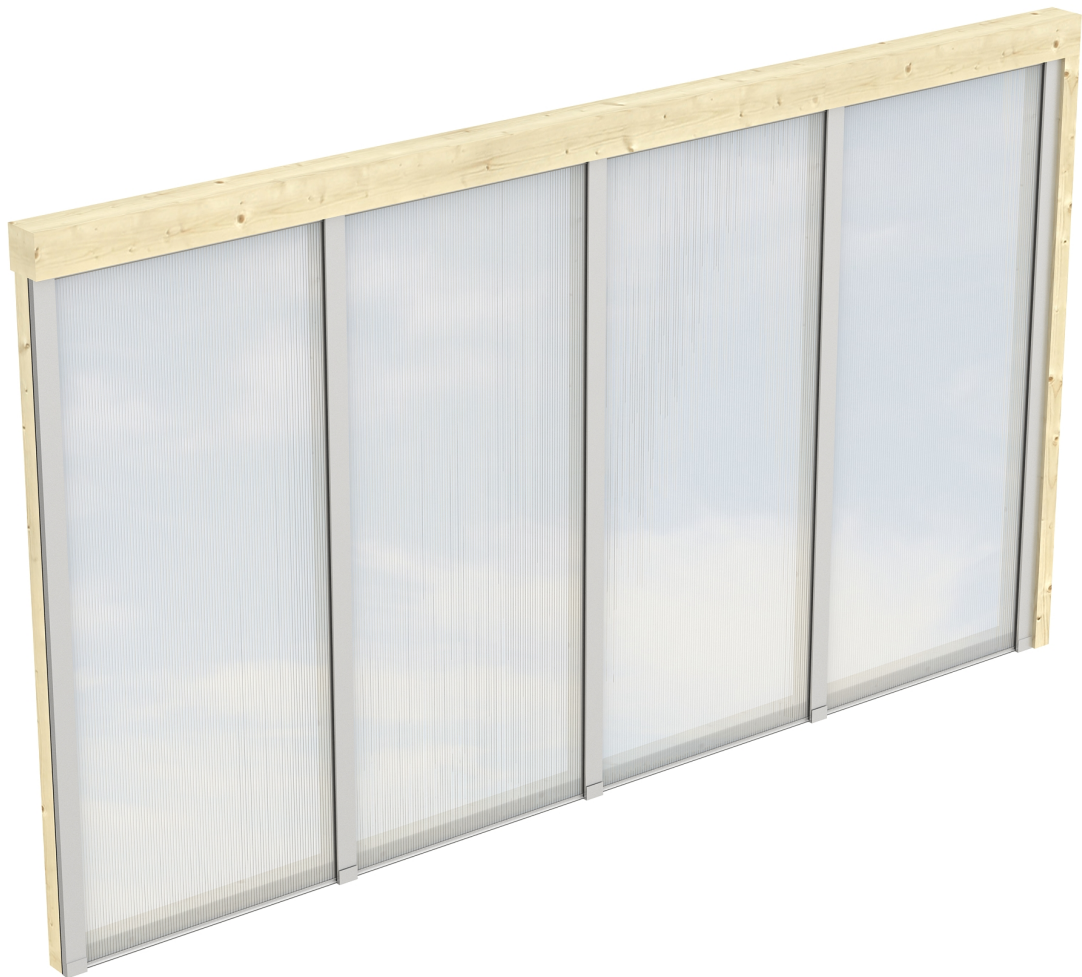
Produktbild Polycarbonat-Seitenwand 355cm