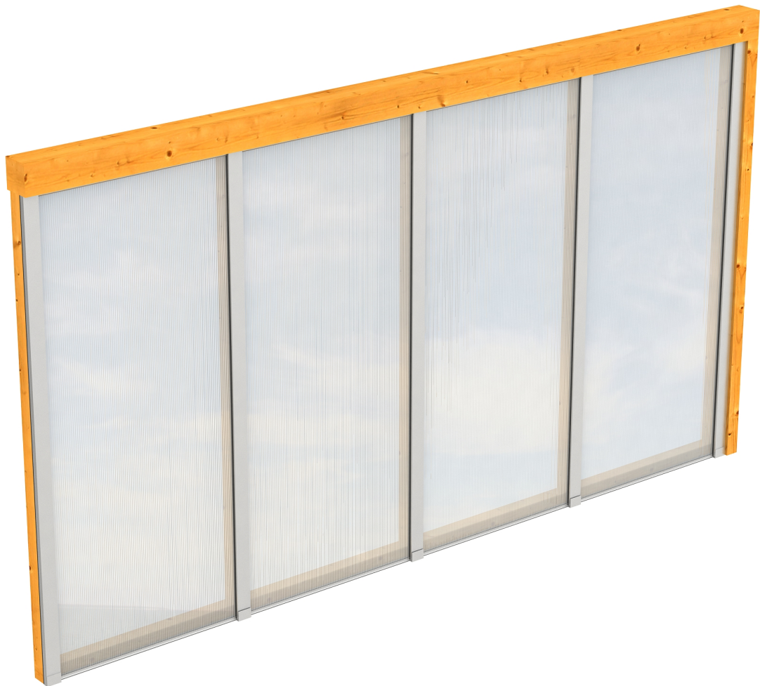
Produktbild Polycarbonat-Seitenwand 355cm