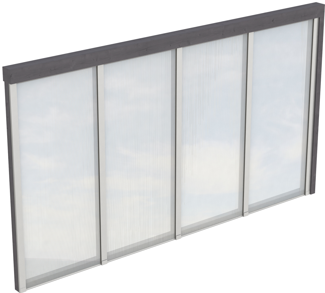
Produktbild Polycarbonat-Seitenwand 355cm