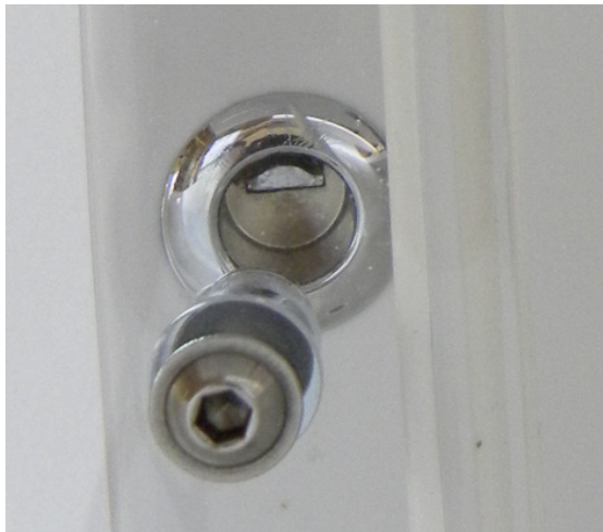
(Abb. 6, Scheibenverriegelung)

Den Stopfen (Abb.5 ), nachdem das Wasser vollständig abgelassen wurde, entfernen und diesen in die neben der Tür befindliche Öffnung (Abb. 7), eindrücken. Die Tür ist jetzt entriegelt und kann geöffnet werden.