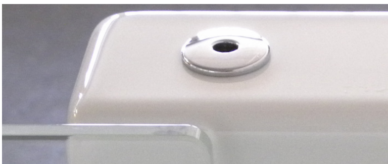
(Abb. 7 Türverriegelung im Wannenrand)