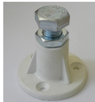
(Abb. 8, Einstellschraube Plattenabstand)