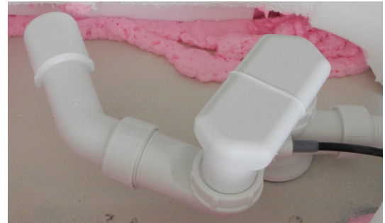
(Abb. 2, Siphon)

Der Wannenträger ist auf der Vorderseite mit Aluminium beschichteten Kunststoffplatten (3-teilig) zum Befliesen ausgestattet. WICHTIG! - mit Haftgrund vorbereiten, Bsp. PCI303 für glatte, nicht saugende, Oberflächen. An den beiden abnehmbaren Frontplatten, rechts und links, sitzen unterhalb des Wannенrandes verstellbare Füße (Abb. 8), um den Abstand zu der Wanne passend einzustellen. Diese können nach Bedarf neu justiert werden. Diese Frontplatten sind mit ein wenig handelsüblichem Silikon am Wannenträger zu befestigen. Sie dienen gleichzeitig als Revisionsöffnungen wenn der Ablauf verstopft ist oder mechanische Probleme mit den Türscharnieren oder dem Verriegelungsmechanismus auftreten sollten. Beim Verlegen von Fliesen ist darauf zu achten, dass die Fugen (Abb. 3) vorhanden bleiben und nur mit Silikon verschlossen werden.