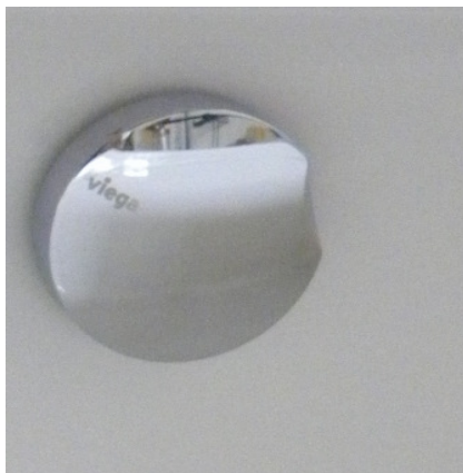
(Abb. 4, Excenterdrehknopf mit Überlauf)