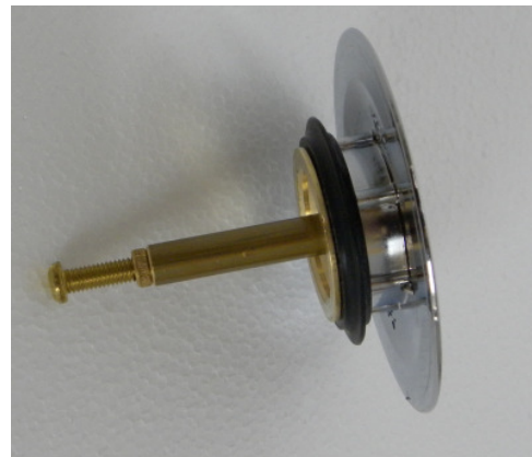
(Abb. 5, Ablaufstopfen)

Nachdem die Wanne mit Wasser gefüllt ist kann sie ringsherum mit Silikon verfugt werden. (Bitte mindestens 24 Stunden zum Aushärten stehen lassen).