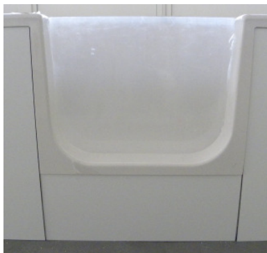
(Abb. 3, Fugen Einstieg vordere Seite)

Der Wannenträger ist auf der Vorderseite mit Aluminium beschichteten Kunststoffplatten (3-teilig) zum Befliesen ausgestattet. WICHTIG! - mit Haftgrund vorbereiten, Bsp. PCI303 für glatte, nicht saugende, Oberflächen. An den beiden abnehmbaren Frontplatten, rechts und links, sitzen unterhalb des Wannенrandes verstellbare Füße (Abb. 8), um den Abstand zu der Wanne passend einzustellen. Diese können nach Bedarf neu justiert werden. Diese Frontplatten sind mit ein wenig handelsüblichem Silikon am Wannenträger zu befestigen. Sie dienen gleichzeitig als Revisionsöffnungen wenn der Ablauf verstopft ist oder mechanische Probleme mit den Türscharnieren oder dem Verriegelungsmechanismus auftreten sollten. Beim Verlegen von Fliesen ist darauf zu achten, dass die Fugen (Abb. 3) vorhanden bleiben und nur mit Silikon verschlossen werden.