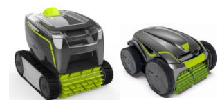
Roboter Robot GT3220/GV3420