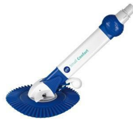
Automatischer Bodenreiniger Automatic cleaner AR20682