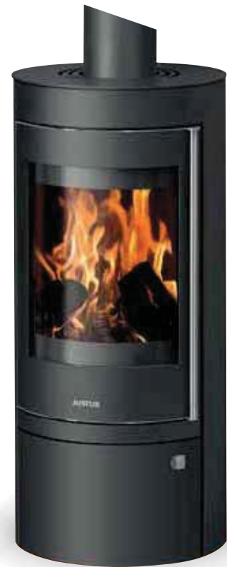
Mino Top 2.0 Stahl Schwarz