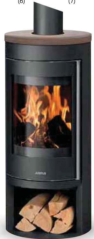
Mino 2.0 Abdeckplatte Grappa, Korpus Stahl Schwarz