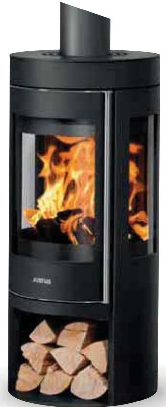
Mino Trios 2.0 Stahl Schwarz