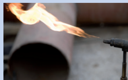
Flammstrahlen von Stahl