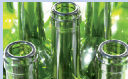
Berußen von Glasformen