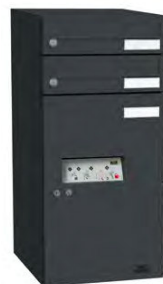
EAA 634 S ANT