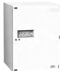
GV 644 S W