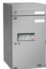
EA 634 S Si