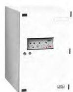
E 634 S W