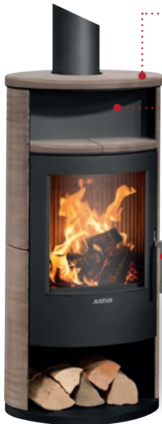
Island 5 Keramik Grappa, Korpus Stahl Schwarz