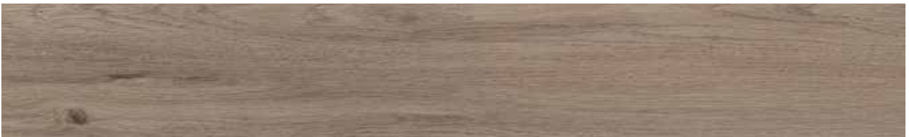
Ash Oak Art.-Nr. 80001904 (KSYM001)