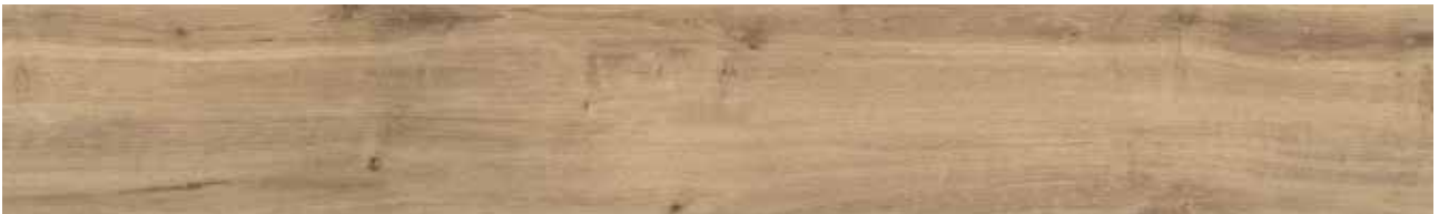
Country Oak Art.-Nr. 80001903 (KSYG001)