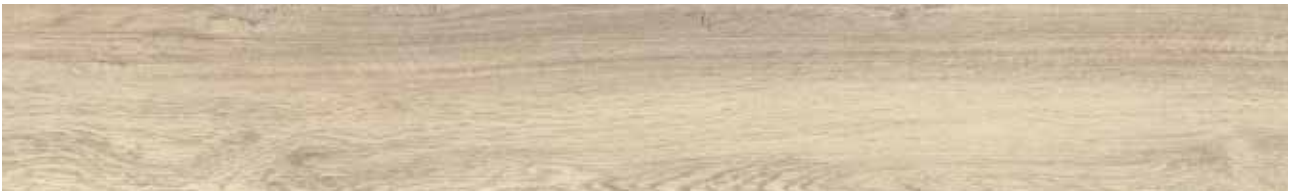
Baltic Oak Art.-Nr. 80001902 (KSYF001)