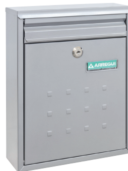
PLATA V-1322 * 113226