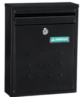
NEGRO V-1324 * 113240