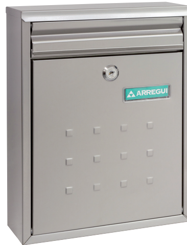
INOX V-1327 * 113271