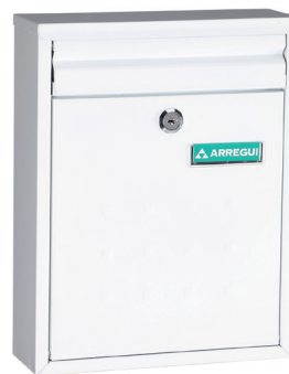
BLANCO V-1321 * 113219