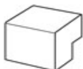
ENLACE CODO EXTERIOR