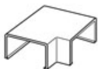
ENLACE PLANO 90°

ESPESOR 1,1 ± 0,1 mm BASE X ALTURA DE ACUERDO AL MODELO