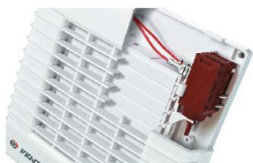
EXTRACTOR OFF -LAMAS CERRADAS