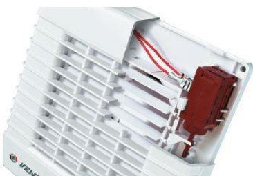
EXTRACTOR ON -LAMAS ABIERTAS