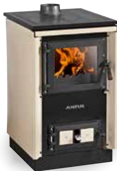
Rustico-50 2.0 Creme (4)