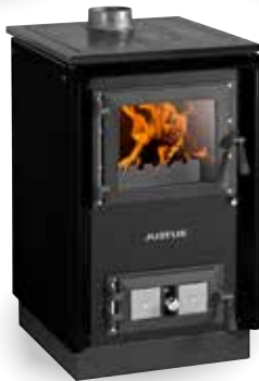
Rustico-50 2.0 Schwarz (1)