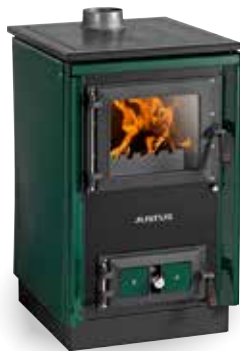
Rustico-50 2.0 Grün (3)