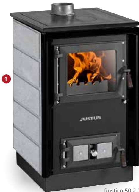
Rustico-50 2.0 Speckstein (5)